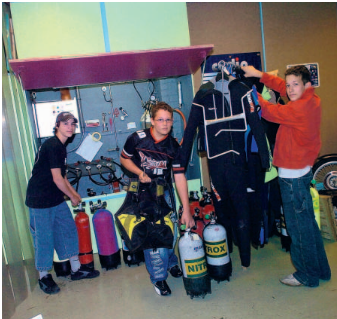
Ces ados passent tout leur temps libre à s'entraîner à la plongée

La plongée, réalisée dans les règles, exige de nombreuses heures