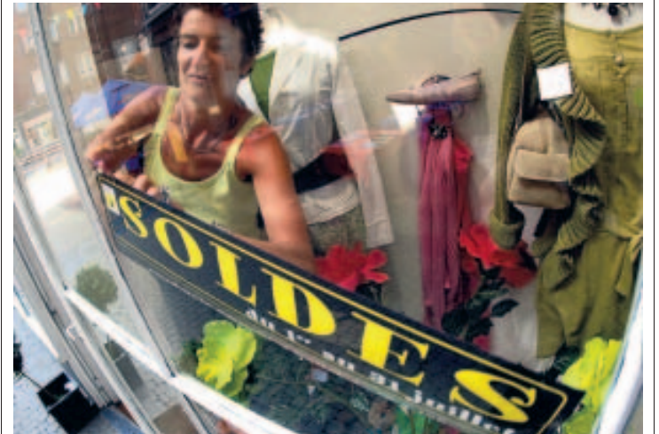
C'est parti pour les rabais.